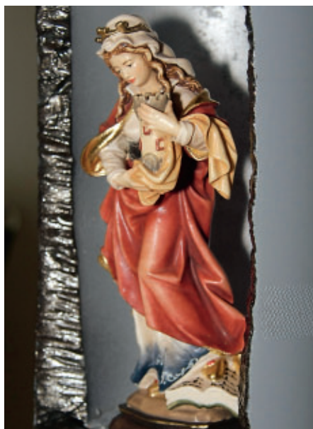
Die Schutzpatronin, die heilige Barbara.