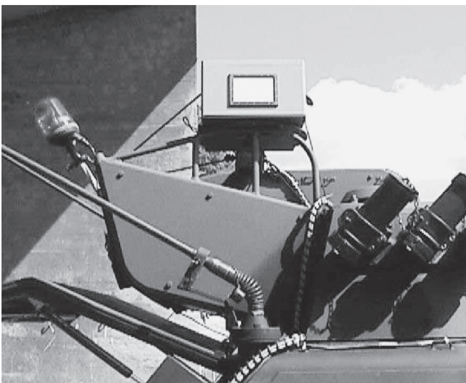
Boîte d'émission (ex: sur le vhc cdt tir) et boîte d'émission / de réception IAV systèmes cdt tir

Il se pose la question pourquoi, à l'ère des simulateurs coûteux et encombrants comme le SAPH KAWEST (installation d'instruction de tir KAWEST) ou le sim cdt tir (simulateur pour des commandants de tir), de tels moyens d'ins-