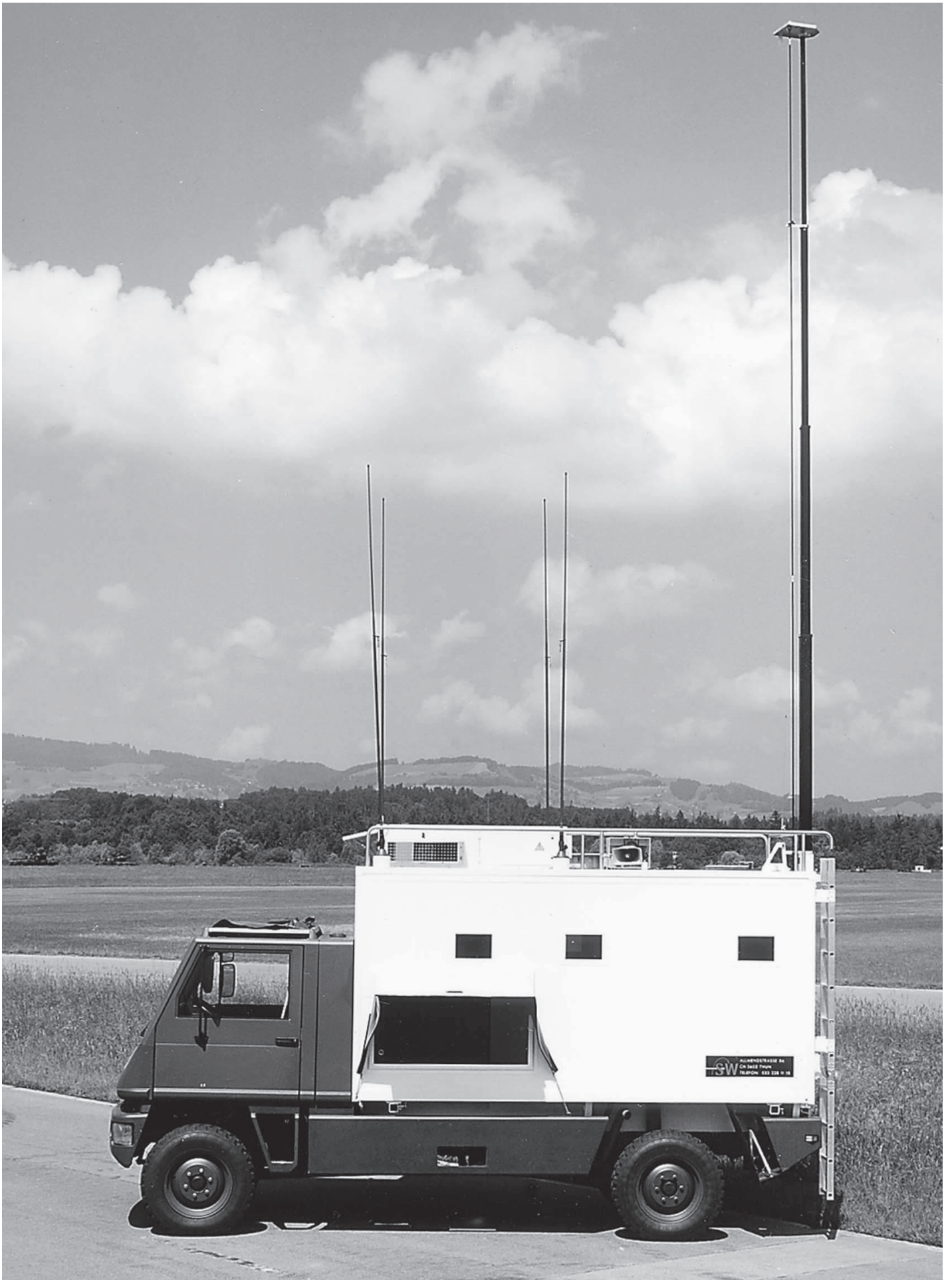
Véhicule de réception DURO IAV KAWEST avec écran extérieur