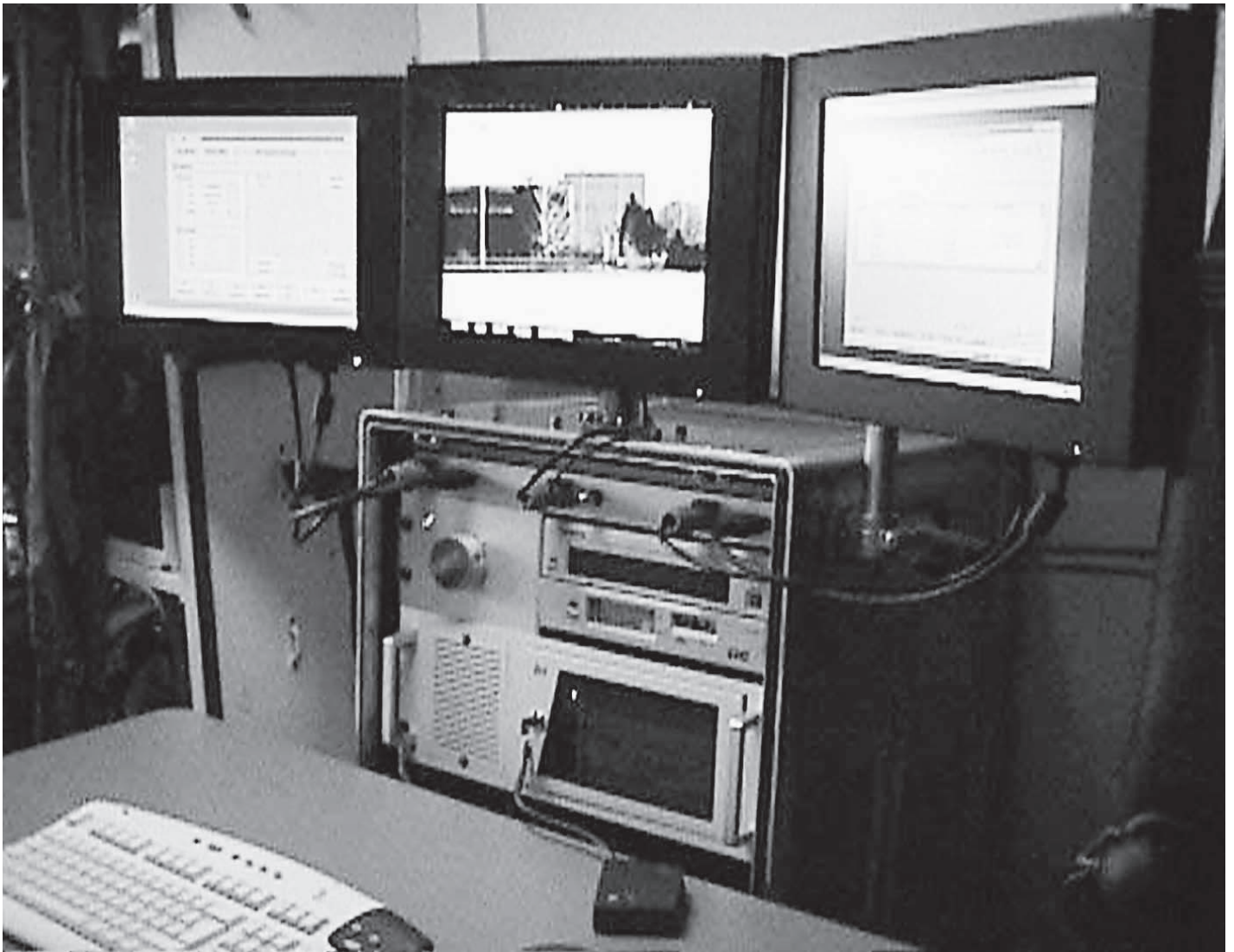
Rack IAV du véhicule d'émission / de réception IAV systèmes cdt tir