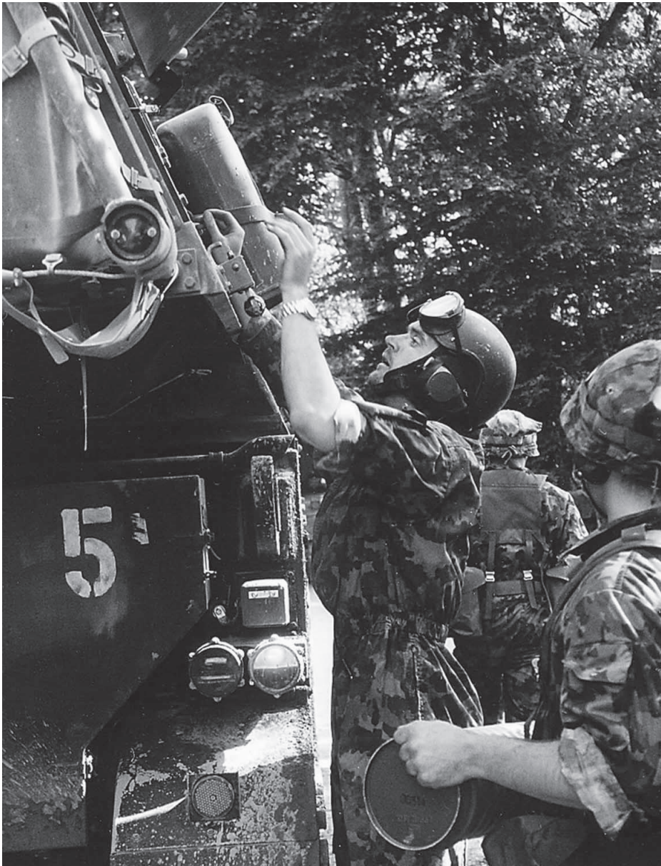
Das Beladen des Ladungsmagazines mussten die Kanoniere der Pz Hb Abt 36 neu erlernen.

getragen. Verstärkt mit Elementen der Dienstbatterie (eine Munitionsgruppe, bestehend aus bis zu drei Lastwagen und einem Feldumschlaggerät FUG), welche die Munition neu im Bringprinzip zu den Batterien führt, muss der Versorgungszugführer mindestens zwei Aufmunitionierungsplätze erkunden und betreiben. Damit wird der bis anhin eher stiefmütterlich betreute Bereich Versorgung stark aufgewertet, wobei die zu Verfügung stehenden Mittel, insbesondere Funk und der wenig gefechtstaugliche FUG, die Leistung aktuell noch limitieren.