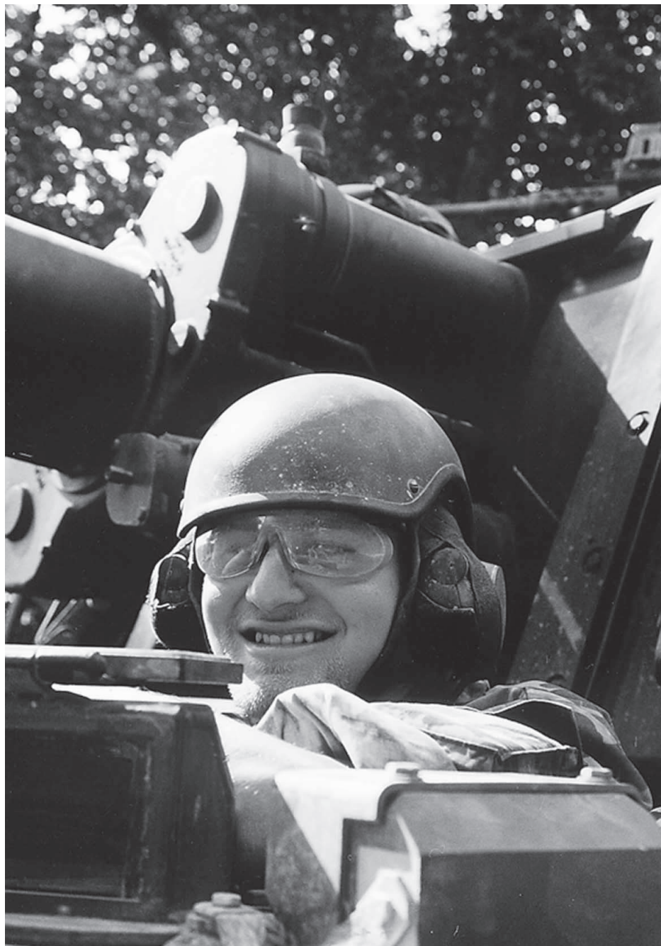
Die Fahrer der Panzerhaubitzen werden im UK KAWEST speziell auf ihre neuen Aufgaben trainiert.

Auch mit dem neu gebildeten Versorgungszug wird der gesteigerten Feuerkraft der Pz Hb KAWEST Rechnung