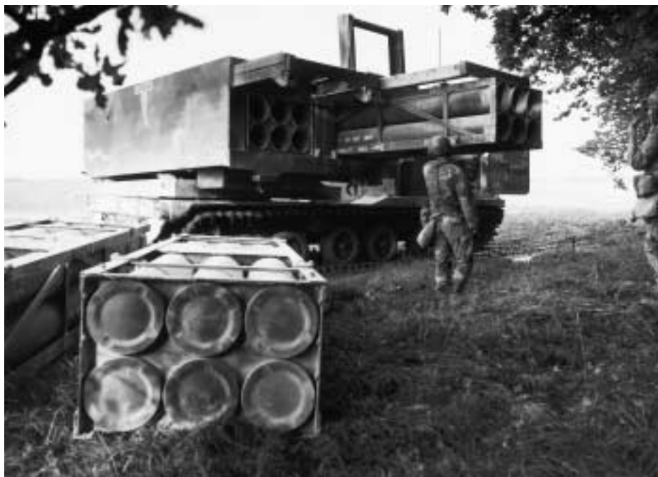
MLRS beim Nachladen

Die Raketen haben eine Länge von 3,937 m, einen Durchmesser von 227 mm und je nach Typein Gewicht von 260 bis 307 kg. Bei den Bombletraketen entfällt rund je die Hälfte auf den Raketenmotor und den Gefechtskopf. Je sechs Raketen befinden sich in einem Einweg-Raketen-Lager-, Transport- und Abschussbehälter. In diesem können sie wartungsfrei gelagert, transportiert und daraus verschossen werden. Die Raketen M26/M26A1 enthalten Bomblets, die nebst den Splittern nach dem Hohlladungsprinzip wirken und in der Lage sind, leichte Panzerungen von oben zu durchschlagen. Die enorme Feuerkraft des MLRS sollen folgende Zahlen dokumentieren: Bei einem Feuerauftrag mit Bombletraketen werden von zwei Werfern in einer Minute 24 Raketen verschossen; das bedeutet ca. 7800 Bomblets. Dies entspricht rund 120 Kanistergeschossen einer Pz Hb Abt KAWEST und sportlichen 7 Schuss pro Minute.