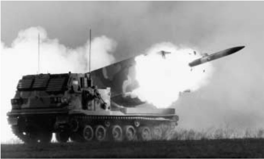
MLRS mit Basisrakete M26

der ersten vier in der EU gefertigten MARS/MLRS an die vier beteiligten Nationen. Die Auslieferung der insgesamt 284 in Europa hergestellten Mehrfachraketenwerfer endete 1994. Inzwischen wird das Waffensystem in rund 1400 Stück in über 16 Ländern eingesetzt, davon nahezu 900 MLRS in den US-Streitkräften. Für die USA wurden rund 450 000 taktische Raketen hergestellt, während die vier europäischen Herstellerländer rund 128 000 Bombletraketen und 73 000 AT2-Raketen produzierten. Mit weiteren Ländern werden Beschaffungsverhandlungen geführt.