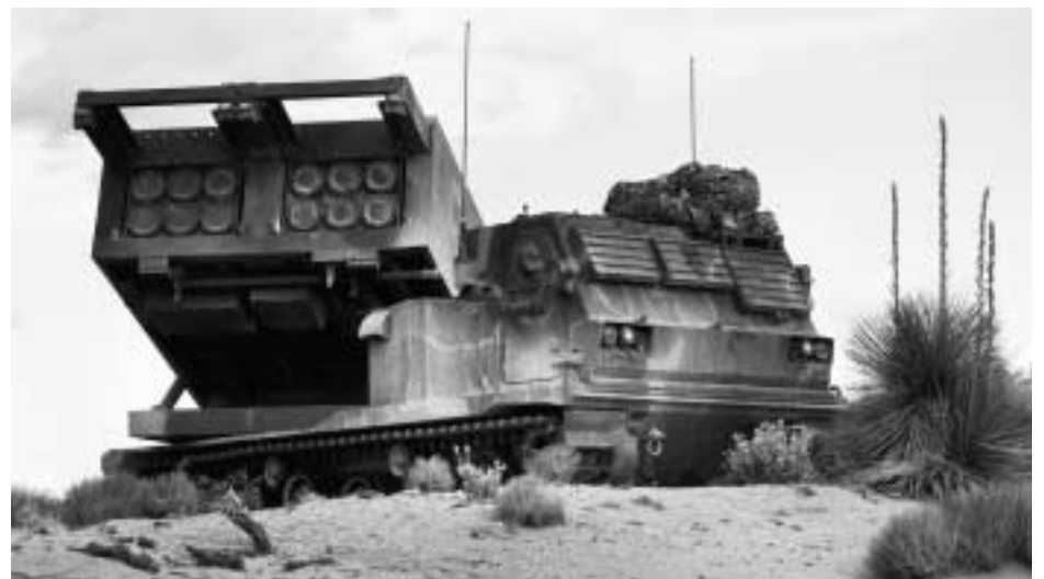
MLRS-Multiple Launch Rocket System