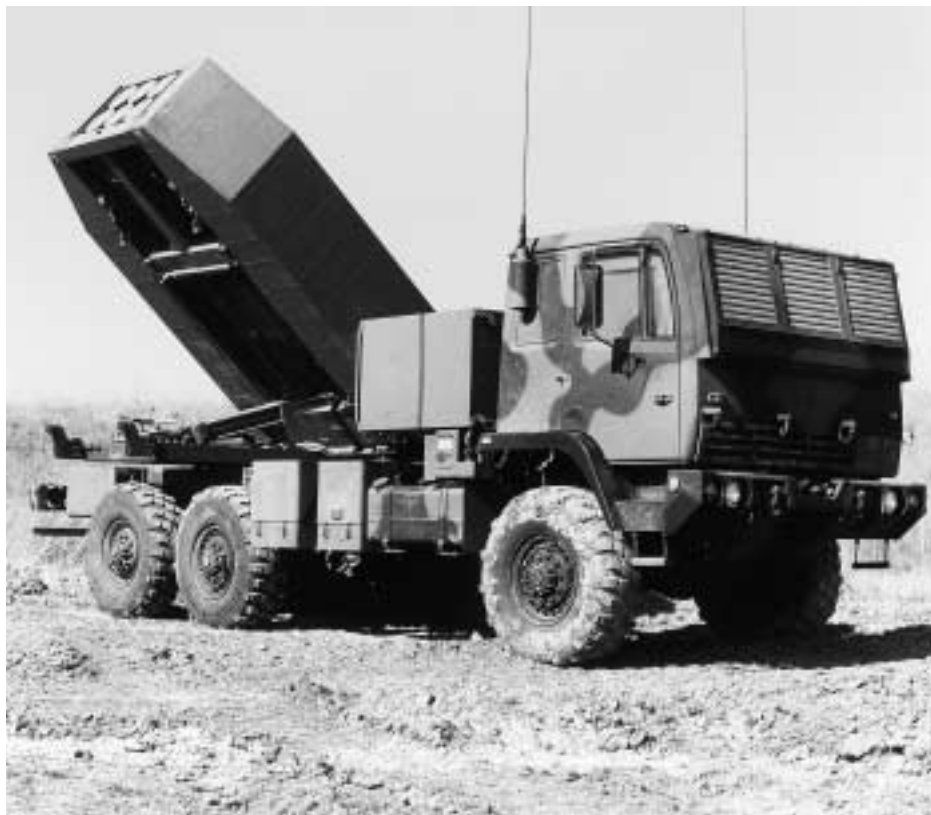
HIMARS-High Mobility Artillery Rocket System

Für HIMARS ist die Aufnahme der Vorserieproduktion vorgesehen für das Jahr 2003 mit einer Truppeneinführung bei der U.S. Army und U.S. Marines ab 2005.