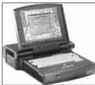
INTAFF Laptop : un ordinateur militarisé