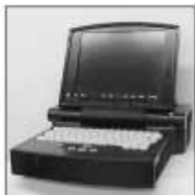
INTAFF Laptop : un ordinateur militarisé