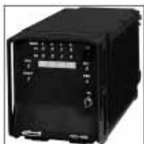
INTAFF TCC : le coeur de toutes les communications