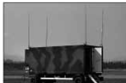
INTAFF Véhicules : le container du CCF