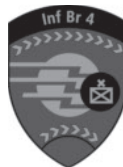
Der neue Badge der Inf Br 4.

Zum Aufbau der Kampfkompetenz braucht es mehr Zeit, denn erstens ist die Kampfaufgabe komplexer als die